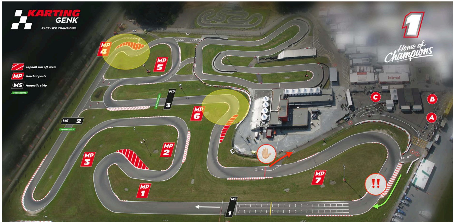
Afbeelding 4: Bovenaanzicht Genk: Extra opletten en snelheid verminderen bij een gele vlag situatie