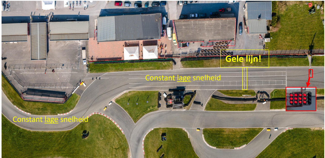
Afbeelding 3. Bovenaanzicht Mariembourg. Aandachtspunten rollende start.